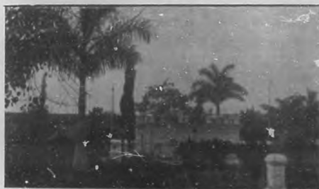
Sagua la Grande.—Mausoleo á los Mártires de la Patria en la Plaza Robau.