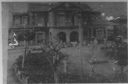
Sagua la Grande.—Estación del ferrocarril.