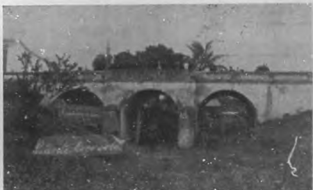
Sagua la Grande.—Puente de "Cocosolo".

Una visita á la Colonia Española, banquete, y baile en "El Liceo" completaron los festejos de un día memorable