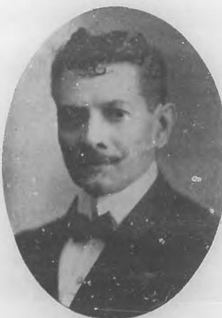
JOSÉ VILALTA DE SAAVEDRA Notable escultor cubano.