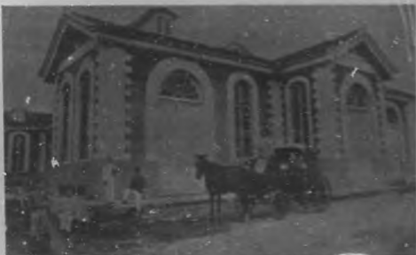
Sagua la Grande.—El Matadero.