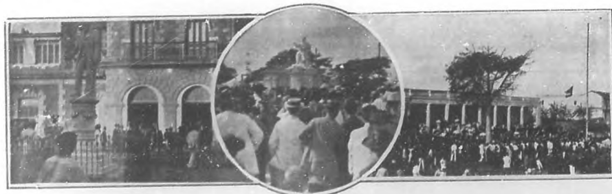
La llegada de las comisiones de la Habana, al salón de la Estación de ferrocarril.