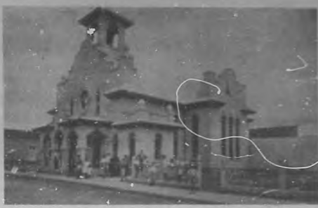
Sagua la Grande.—Iglesia Bautista.