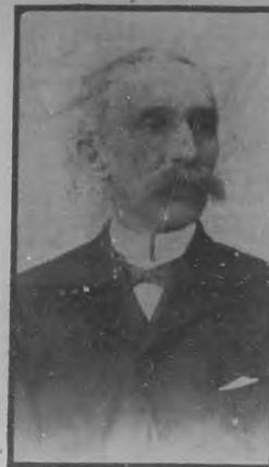
SR. TOMAS A. RECIO Senador por la Provincia de Camagüey fallecido recientemente