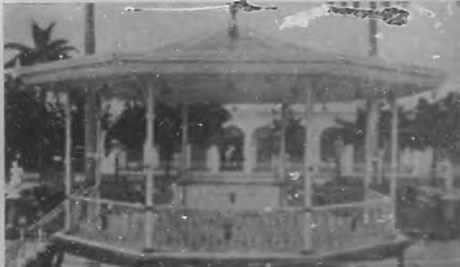
Sagua la Grande.—"Alfert" Templo de la Música.